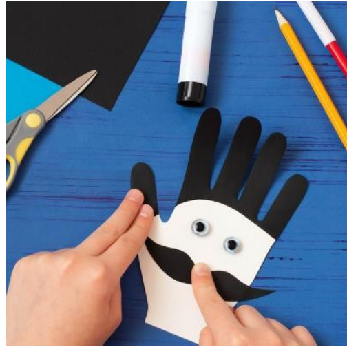
Etape 12 : Coller Collez le noeud papillon sur le bas de la main blanche.