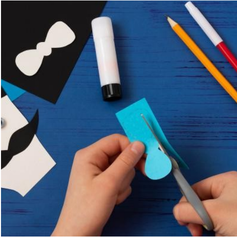
Etape 11 : Découper Découpez le noeud papillon.